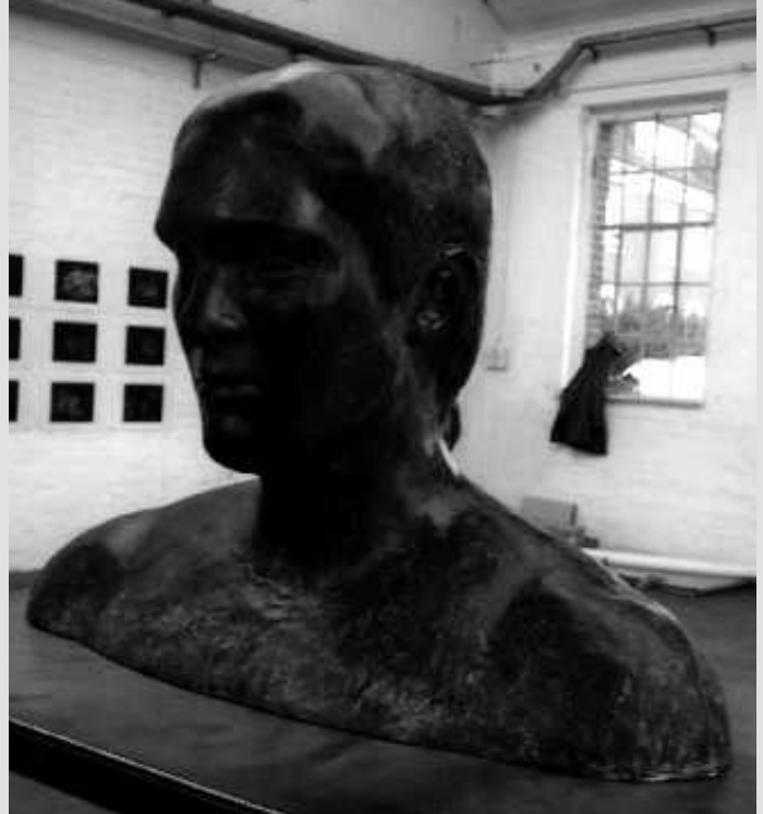
Bronzeskulptur bei der Ausstellung „Serendipity“ in Herne.