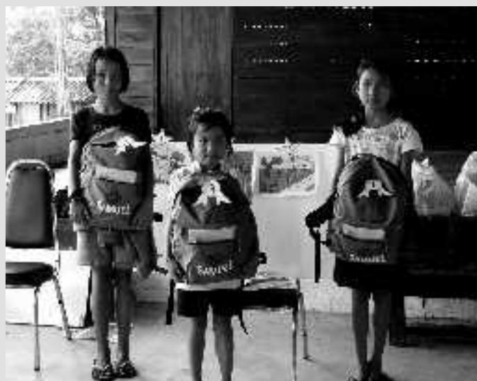
Stolze Gewinner mit ihren Preisen.