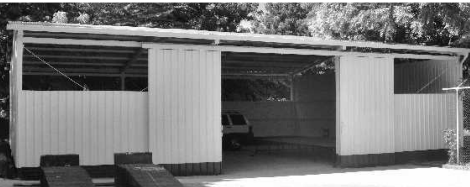
Vorderansicht der Werkstatt kurz vor Fertigstellung.