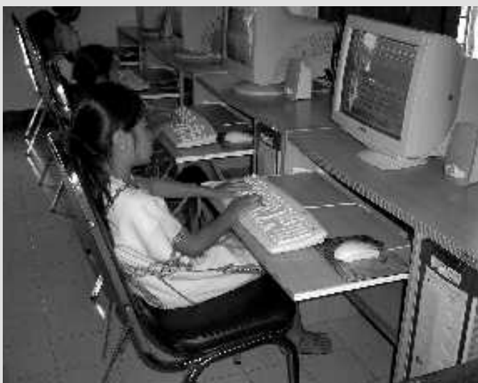
Auch in den Ferien standen Computerkurse auf dem Unterrichtsplan.