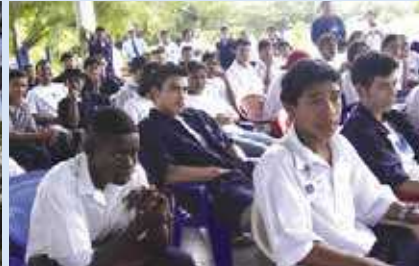
Berufsausbildungszentrum der Samuel-Stiftung in Managua, Nicaragua