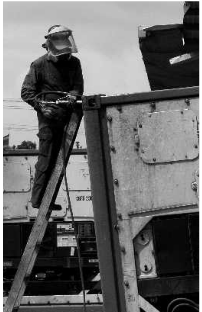
Reparaturarbeiten an einer Kühleinheit.