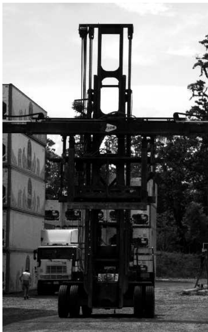
Große Gabelstapler sind nötig, um die Kühlcontainer auf die LKWs zu laden.