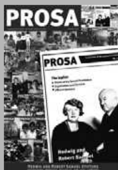
Titelfoto: Die Titelbilder der Prosa im Laufe der Zeit. Das Erscheinungsbild hat sich in den zurückliegenden 10 Jahren immer wieder gewandelt. In Zukunft wird die Prosa als Online-Newsletter erscheinen.