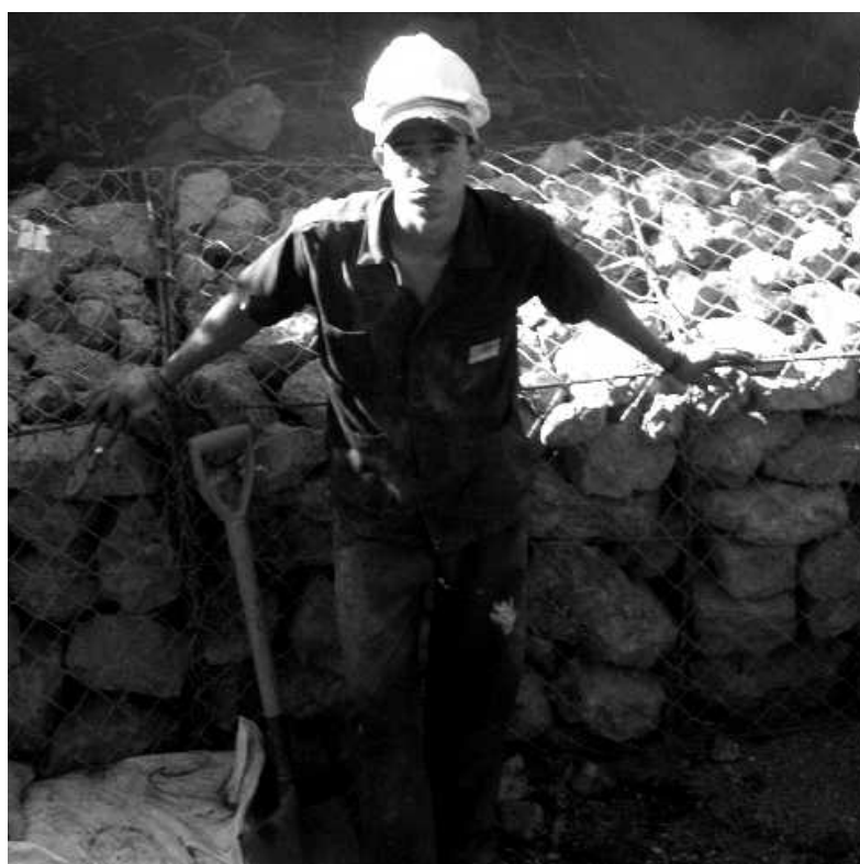
Kurze Verschnaufpause, nachdem die ersten Gavionen (im Hintergrund zu sehen) befestigt worden sind.