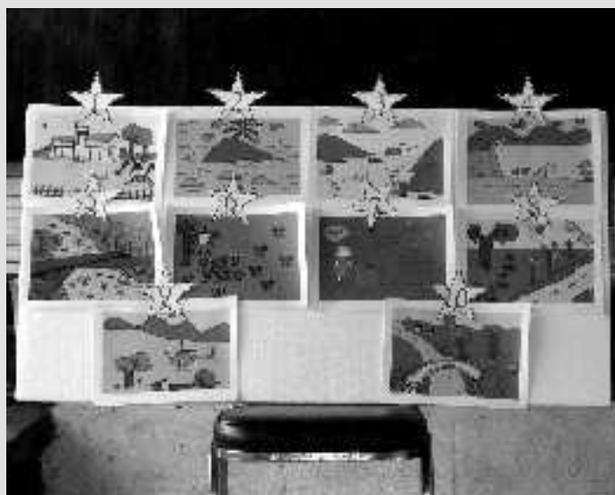
Als Wettbewerb sollten die Kinder Zeichnungen am Computer entwerfen.

IM OKTOBER SIND TRADITIONELL SCHULFERIEN IN THAILAND. DIE SCHULKINDER, DIE WIR DORT BETREUEN, WOLLTEN ABER KEINESWEGS EINEN GROSSEN BOGEN UM DIE SCHULE MACHEN. SIE WOLLTEN WEITERLERNEN. WIE IN DEN LETZTEN JAHREN AUCH HABEN WIR DAS GERNE AUFGEGRIFFEN UND AN DEN BEIDEN DORFSCHULEN, DIE WIR IM UMGEBUNG VON SERMNGAM BETREUEN, ÜBER DREI WOCHEN LANG EXTRAAKTIVITÄTEN ANGEBOten: 86 SCHÜLERINNEN UND SCHÜLER SOLLTEN DEN UMGANG MIT DEM COMPUTER AUF SPIELERISCHE WEISE TRAINIEREN.