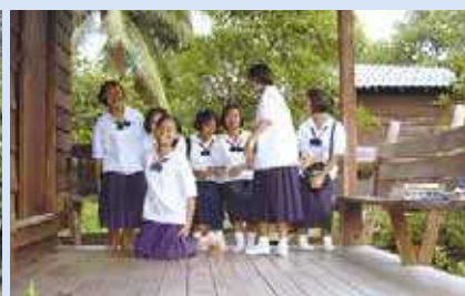
Büro- und Ausbildungsstätte der Samuel-Stiftung bei Lampang, Thailand