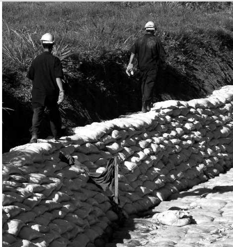
Die schweren Sandsäcke bieten Schutz vor Erosion.

Unser Ausbildungskurs „Bauhandwerk“, der für das Projekt mit früheren Absolventen der Stiftung verstärkt worden ist, hat ganze Arbeit geleistet. Die Jugendlichen wurden dabei tatkräftig von Partnern der Stiftung unterstützt: So stellte die Stadtverwaltung von Managua dankenswerterweise Mischmaschinen, Bagger und Baumaterialien zur Verfügung. Die Firma CONIASA lieferte mit ihren Kipplastern unentgeltlich 80 Kubikmeter Sand an und stellte für die Arbeiten einen Kompaktlader bereit. Und das Instituto de Desarrollo Rural (Institut für Ländliche Entwicklung) stand uns mit fachlicher Beratung und der Baubeaufsichtigung zur Seite.