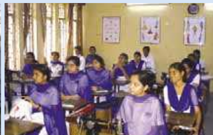
Berufsausbildungszentrum der Samuel-Stiftung in Neu Delhi, Indien