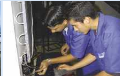
Berufsausbildungszentrum der Samuel-Stiftung in San José, Costa Rica