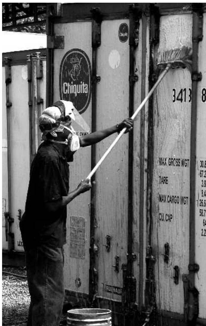
Reinigungsarbeiten sind Teil der Dienstleistung (Das Foto zeigt eine vergleichbare Situation in Puerto Limón).

An die Samuel-Stiftung hat er nur gute Erinnerungen: „Die Stiftung hat mir diesen Weg ermöglicht. Ohne qualifizierte Ausbildung hätte mich kein Unternehmen in diesem Bereich genommen. Schon gar nicht eine so renommierte Firma wie Dole.“ Auf die gute Ausbildung der Samuel-Stiftung vertraut er übrigens auch als Arbeitgeber. Einer seiner Angestellten ist ebenfalls Absolvent der Samuel-Stiftung. Und derzeit hat er zudem zwei Auszubildende der Stiftung als Praktikanten. „Alles gute Leute“, wie er sagt.