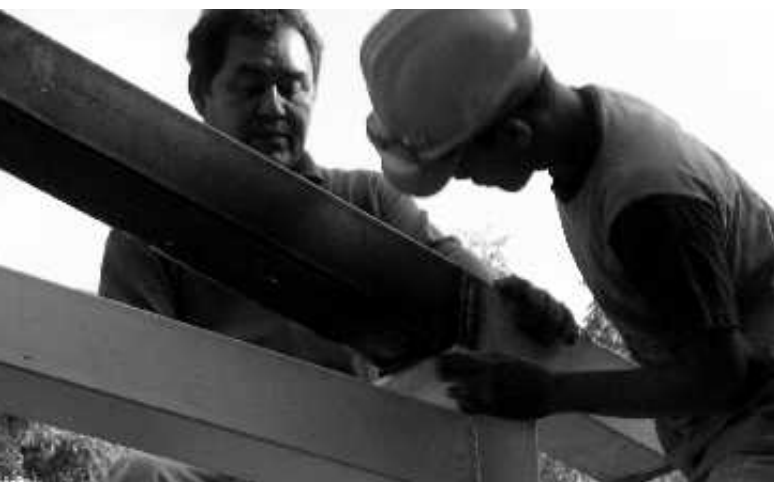
Die Stahlträger werden ausgerichtet und befestigt.

ES IST VOLLBRACHT. INNERHALB VON NUR SECHS MONATEN HAT DIE SAMUEL-STIFTUNG NICARAGUA MIT IHREN AUSZUBILDENDEN DIE NEUE AUTOWERKSTATT AUF DEM AREAL IN MANAGUA ERRICHTET. DIE WERKSTATT WIRD KÜNFTIG ZU AUSBILDUNGSZWECKEN GENUTZT. DIE NOTWENDIGEN GELDER FÜR DEN BAU HATTE DIE JAPANISCHE AGENTUR FÜR INTERNATIONALE ZUSAMMENARBEIT (JICA) BEREITGESTELLT UND DAMIT DEN BAU ERST ERMÖGLICHT (WIR HATTEN DARÜBER IN DER AUSGABE 1/2006 BERICHTET). ALS DANK FINDET DIE DIESJÄHRIGE ABSCHLUSSFEIER ZU EHREN JAPANS STATT. DER JAPANISCHE BOTSCHAFTER WIRD ERWARTET.