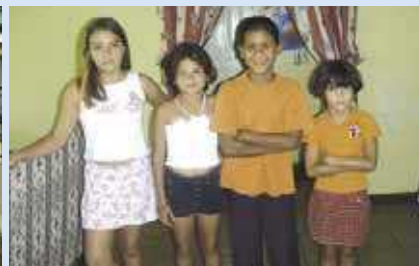
Kinderheim der Samuel-Stiftung in San Isidro, Costa Rica