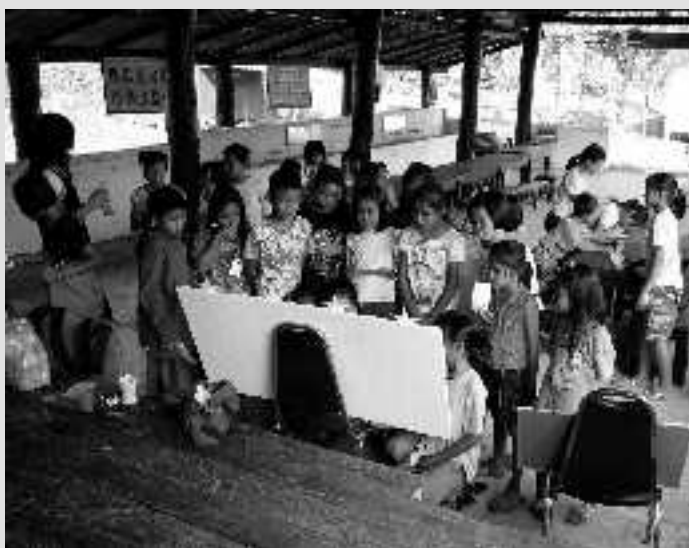
Die Kinder durften die Gewinnerbeiträge selbst auswählen.

Ferien bewältigen mussten. Der Spaß stand dabei immer im Vordergrund. Viel Gelächter gab es zum Beispiel, als die Karaoke-Gesänge der Kinder per Computer aufgenommen und wieder laut abgespielt wurden. Und auch für das Computerspielen hatte die Stiftung ausnahmsweise eine Stunde eingeräumt. „Etwas, worauf die Kinder ganz scharf sind, was aber normalerweise im Unterricht natürlich strengstens verboten ist“, so Gerd Mathia.